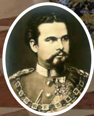
MÄRCHENKÖNIG Ludwig II.