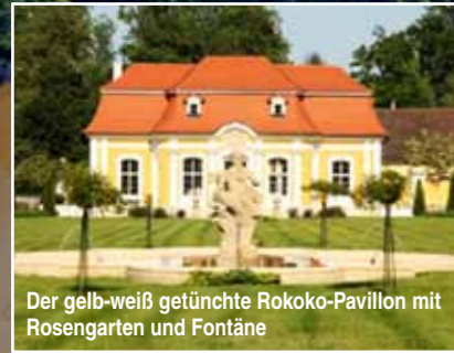
Der gelb-weiß getünchte Rokoko-Pavillon mit Rosengarten und Fontäne