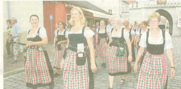
Beim Aichacher Volksfest gaben sich die Organisatoren Mühe, für alle Besucher ein buntes Programm zu bieten: Im Vergnügungspark ebenso wie im Festzelt. Die Bedienung (Bild unten rechts beim Festzug) kümmerten sich um alle – vom Kind (oben) bis zu den Senioren (Bild unten links).

Trotz steigender Besucherzahl und heißer Temperaturen: Zu größeren Zwischenfällen kam es laut Polizei auf dem Aichacher Volksfest nicht. „Aus unserer Sicht ist es sehr ruhig verlaufen“, sagt der Aichacher Polizeichef Rudolf Rothhammer. Es habe auch keine Beschwerden der Anwohner über Lärm gegeben. Lediglich bei einer kleinen Rängelei am Abschlusswochenende musste die Polizei schlichtend eingreifen.